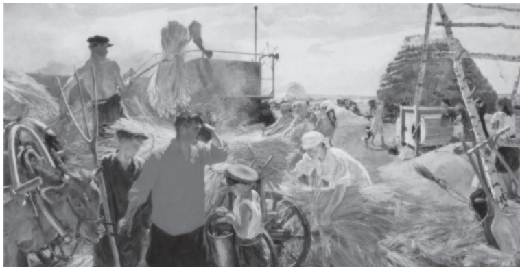
А.А. Пластов. Колхозный ток

«Однажды приехал в отпуск офицер с Дальнего Востока. Пришёл он с женой купаться на пруд, собрал нас, мальчишек, и стал рассказывать про себя (это был командир танка, служил на Дальнем Востоке). Рассказывал о наших советских танках, об их хороших боевых качествах, а мы с большим интересом слушали его рассказы и задавали вопросы, интересовались: “Он, танк, что ли, как медведь? Ведь медведя пуля не берет!” Офицер объяснил нам, что танк сделан из стали, которую не пробивает ни пуля, ни снаряд. И я подумал: “Как хорошо быть таким человеком, управлять такой машиной! Все мальчишки были в восторге от военного и бегали за ним попятам».