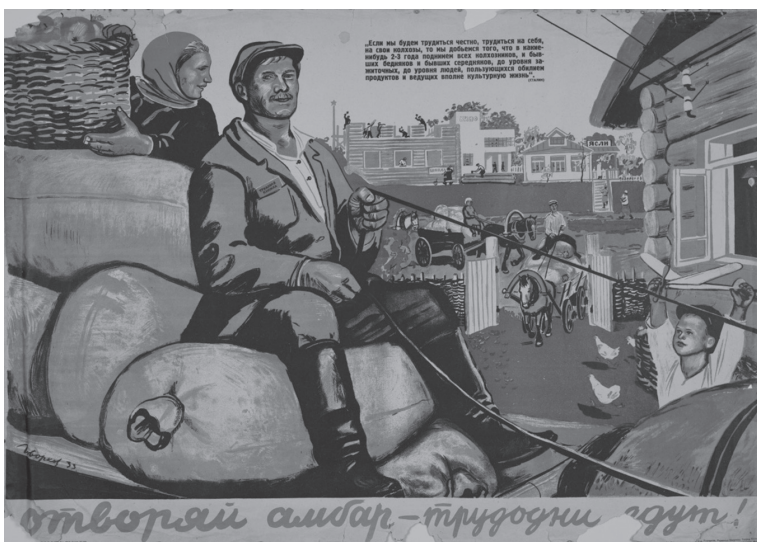
Советский плакат 1930-х годов

ведать?». В то время была свежа память о гражданской войне и видимо поэтому хозяева дома поверили, скорее всего ещё и плохо видели, они сказали: «Да, сейчас молочка нальем». Хулиганистые дети говорят: «Мы через час прискачем, готовьте стол». Через час возвращаются, а там полный банкет. Пришлось признаться».