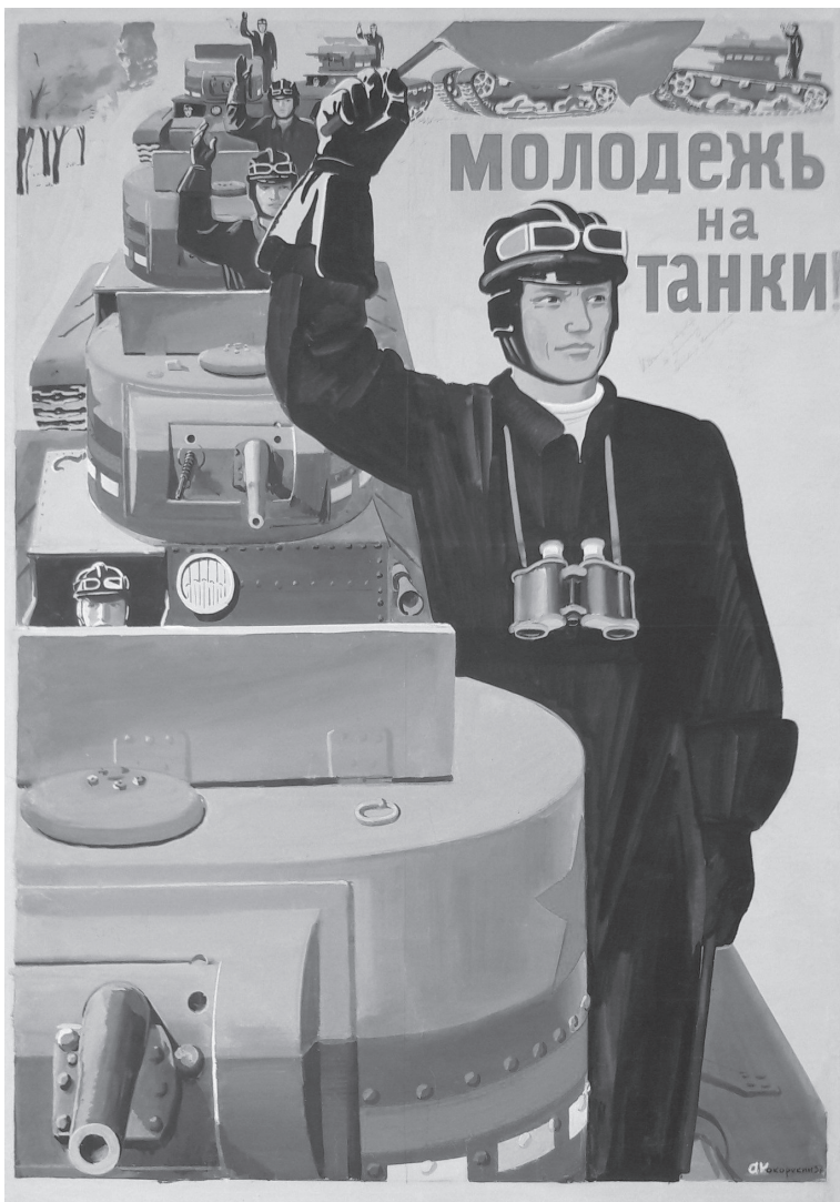
Советский плакат 1930-х годов

которые занимались техническим обслуживанием колхозов, ремонтом техники и подготовкой кадров механизато-