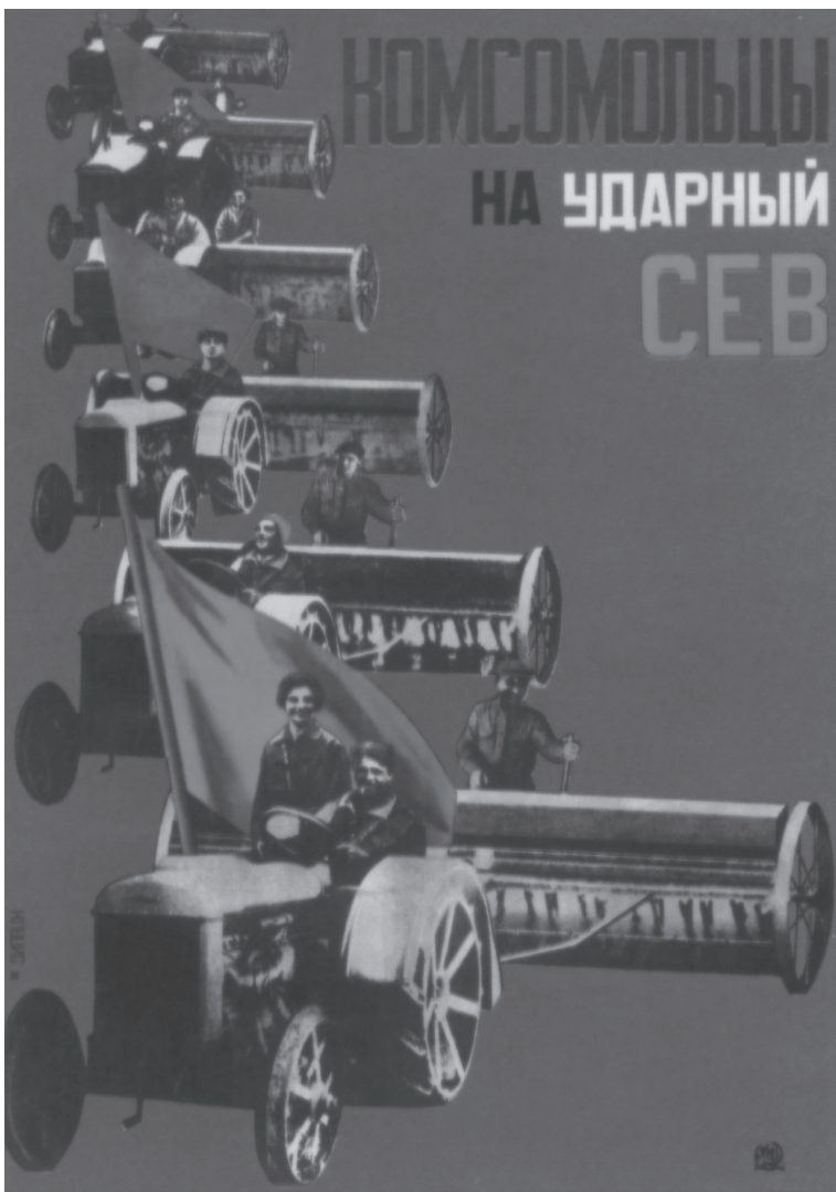
Советский плакат 1930-х годов

советско-финской войны призвали много отслуживших солдат. Не все из них вернулись домой, а среди вернувшихся были раненые и обмороженные.