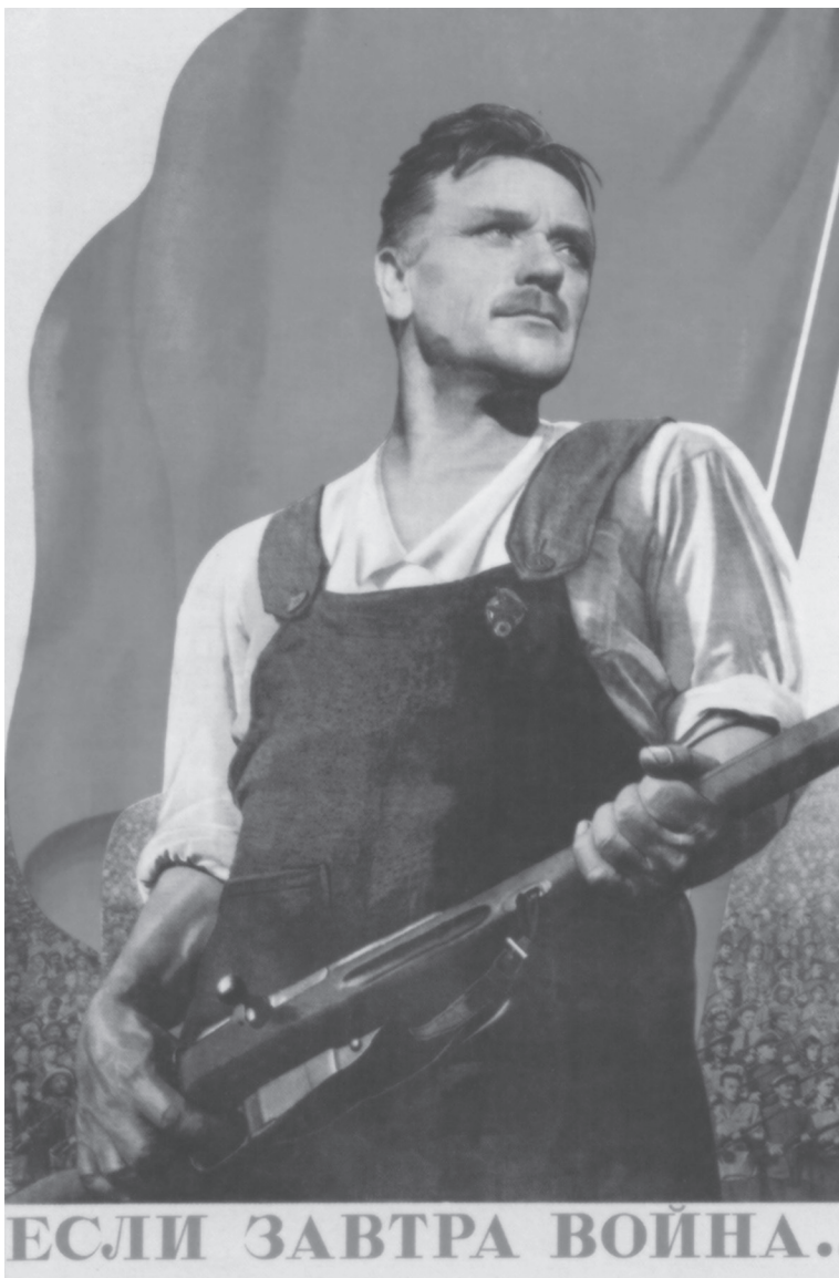
Советский плакат 1930-х годов