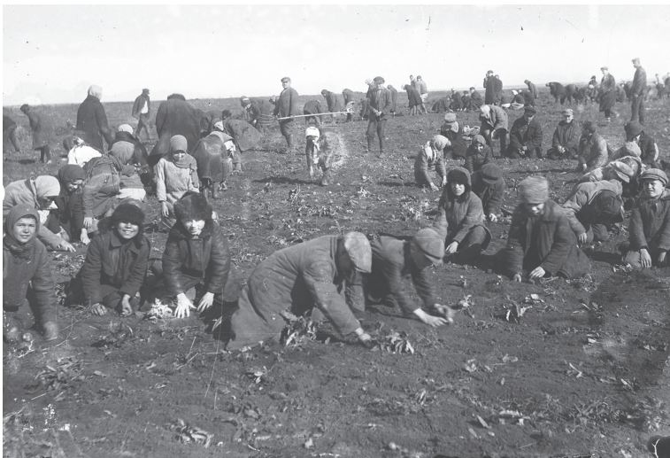
Голод 1933 года