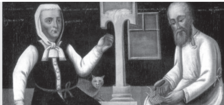
«Муж лапти плетёт, жена нити прядёт». Картина неизвестного художника по мотивам народного творчества».

«С наступлением холодов работы в доме хватало. Отец ухаживал за скотиной, и было у него ещё одно занятие: он не успевал плести лапти нам, мальчикам, постоянно бегавшим по улицам. Мать зимой одевала всю семью: пряла коноплю, затем ткала и шила одежду, поскольку купить её было почти невозможно. И вся одежда, которую мы носили, была холщовая.»